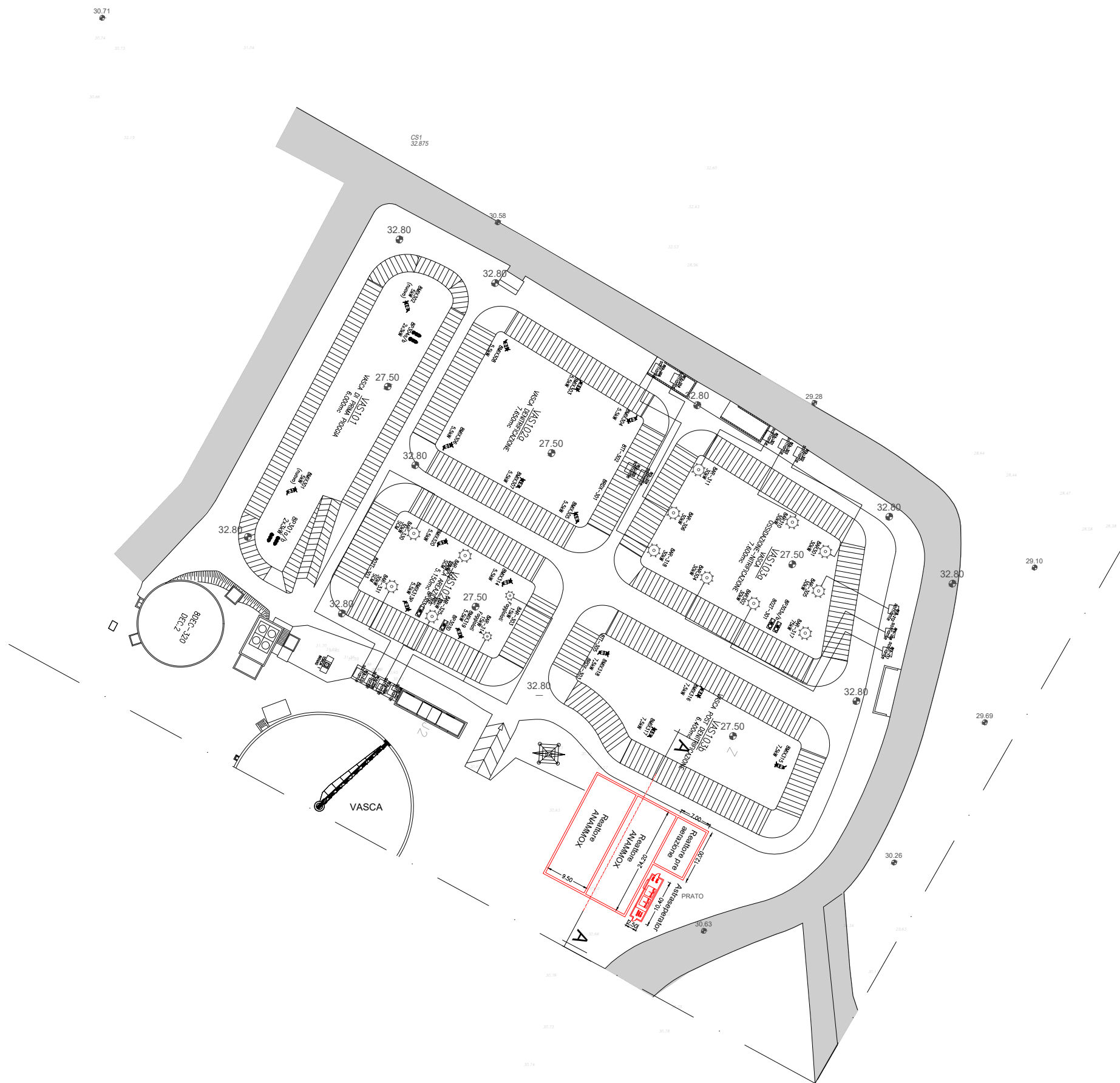
PIANTA Scala 1:1000